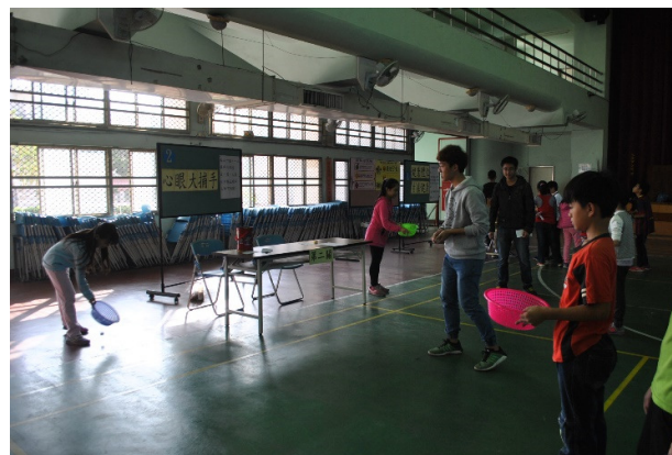
說明：藉由闖關活動加強視力保健宣導