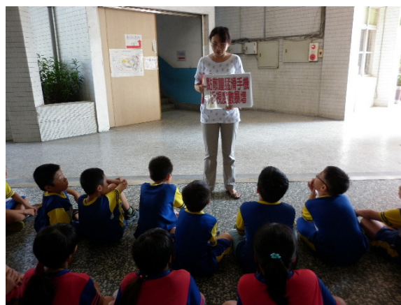
說明：護理師定期宣導適當使用手機