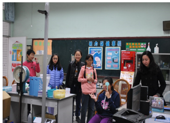
說明：每學期定期視力檢查